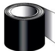
NOIR 0003 RAL 9005