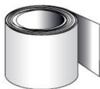
BLANC 0001 RAL 9016