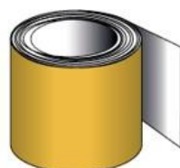
JAUNE 0005 RAL 1021